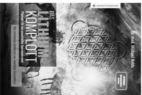
Das Buch zum Vortrag

Erfahren Sie, wie Lithium den Weg in eine selbstbestimmte Zukunft ebnen und unser gesamtes Verständnis von Gesundheit revolutionieren könnte.