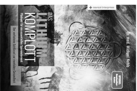
Das Buch zum Vortrag

Erfahren Sie, wie Lithium den Weg in eine selbstbestimmte Zukunft ebnen und unser gesamtes Verständnis von Gesundheit revolutionieren könnte.