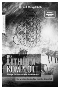
Das Buch zum Vortrag

Ein vergessenes Spurenelement könnte unser Leben und das unserer Kinder entscheidend verändern: Das Beheben des heutzutage weitverbreiteten Lithium-Mangels stärkt das mentale und körperliche Immunsystem, steigert die Lebensfreude und birgt sogar das Potential, die Lebenszeit zu verlängern!