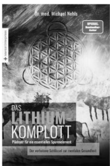
Das Buch zum Vortrag

Ein vergessenes Spurenelement könnte unser Leben und das unserer Kinder entscheidend verändern: Das Beheben des heutzutage weitverbreiteten Lithium-Mangels stärkt das mentale und körperliche Immunsystem, steigert die Lebensfreude und birgt sogar das Potential, die Lebenszeit zu verlängern!