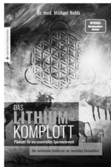
Das Buch zum Vortrag

Ein vergessenes Spurenelement könnte unser Leben und das unserer Kinder entscheidend verändern: Das Beheben des heutzutage weitverbreiteten Lithium-Mangels stärkt das mentale und körperliche Immunsystem, steigert die Lebensfreude und birgt sogar das Potential, die Lebenszeit zu verlängern!