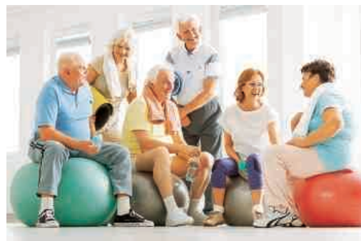
Sportliche Betätigung und soziale Kontakte unterstützen unser Gedächtnis

Doch keine Sorge, Sie müssen nicht sofort alles umstellen, sondern können kleine, unkomplizierte Änderungen in Ihren Alltag integrieren. Verwenden Sie z. B. die geschmacksneutrale Variante des Kokosöls anstelle von Butter als Brotaufstrich. Backen Sie Ihre